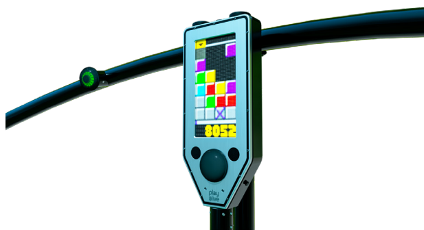
Nærbillede af display, "Blocks" gameplay.

Wave og dens tilhørende aktiviteter er designet til at øge fysisk bevægelse, mens der spilles og leges. Det er en fusion af spilverden og fysisk aktivitet.